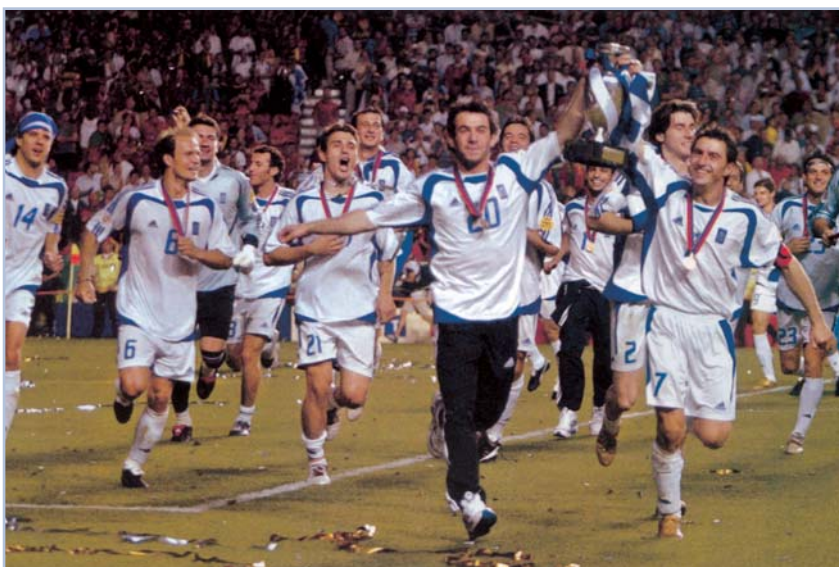
Η Εθνική Ελλάδας πανηγυρίζει για την κατάκτηση του Κυπέλλου στο ευρωπαϊκό πρωτάθλημα ποδοσφαίρου (Ιούλιος 2004)

Σημαντικός ποιητής, από τους εκπροσώπους της μοντέρνας ιταλικής ποίησης. Τα ποιήματά του χαρακτηρίζονται από συναισθηματική συμπύκνωση και πάθος και είναι συγκεντρωμένα στη συλλογή Καντσονιέρε (1961).