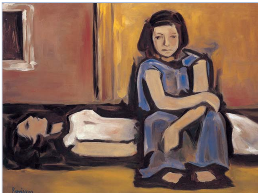
Ορέστης Κανέλλης, Παρουσία