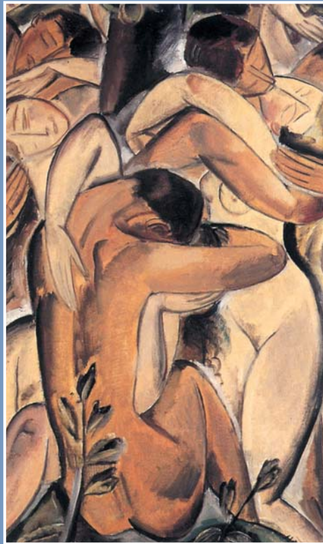
Γιώργος Γουναρόπουλος, Γυμνά ειδύλλια που φιλιούνται

Τα έξι κείμενα που περιλαμβάνονται σ' αυτή την ενότητα περιστρέφονται γύρω από τους δυο σημαντικότερους ίσως συνεκτικούς δεσμούς της κοινωνικής μας ζωής, την αγάπη και τη φιλία. Η έννοια της αγάπης έχει πολλαπλά νοήματα, γι' αυτό και τα ανθολογημένα λογοτεχνικά κείμενα αναπτύσσονται γύρω από διαφορετικές εκδοχές της: τη χριστιανική και πανανθρώπινη αγάπη, σύμφωνα με την οποία η αγάπη αποτελεί το συνεκτικό ιστό της κοινωνικής ζωής· την αγάπη προς το συνάνθρωπο, ως κύρια ανθρωπιστική αξία, η οποία συνέχει την κοινωνική ζωή, ωθώντας τους ανθρώπους στην ειρηνική συνύπαρξη και όχι στην αλληλοεξόντωση· την ερωτική αγάπη, είτε πρόκειται για τον πρώτο «πλατωνικό έρωτα» της παιδικής ηλικίας είτε για το μεγάλο έρωτα της ενήλικης ζωής. Η δική σας ηλικία, μακριά από τις μέριμνες της ενήλικης ζωής, προσφέρεται περισσότερο από κάθε άλλη για να κατανοήσετε και να βιώσετε, μέσα και από τα λογοτεχνικά κείμενα, την αξία της αγάπης και της φιλίας.