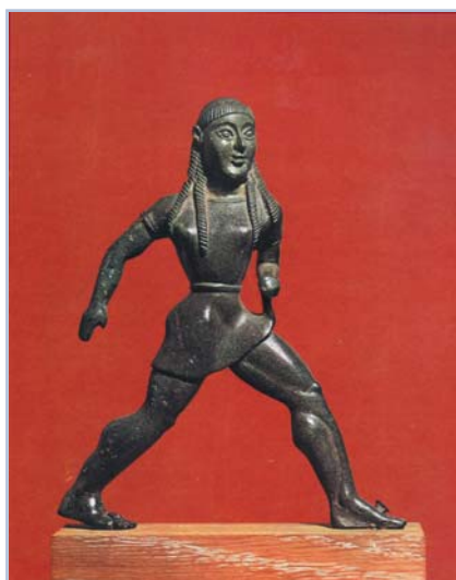
Χάλκινο αγαλματίδιο γυναίκας, Εθνικό Αρχαιολογικό Μουσείο Αθηνών