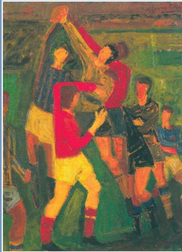
Παναγιώτης Τέτσης, Χωρίς τίτλο

Τα τέσσερα κείμενα που ανθολογούνται σ' αυτή την ενότητα αναφέρονται στη διαχρονική διάσταση του αθλητισμού. Το ποίημα του Λορέντζου Μαβίλη μάς μεταφέρει στους Ολυμπιακούς Αγώνες της αρχαίας Ελλάδας, ενώ το ποίημα του Ουμπέρτο Σάμπα εκφράζει την αγάπη του κόσμου και του ποιητή για την τοπική ποδοσφαιρική ομάδα. Τα διηγήματα του Δημήτρη Μίγγα και του Νίκου Χουλιαρά μάς δίνουν στιγμιότυπα της σύγχρονης ζωής, με επίκεντρο τον αποκαλούμενο «βασιλιά των σπορ», και σίγουρα το πιο αγαπημένο σας άθλημα, το ποδόσφαιρο. Τα περισσότερα κείμενα της ενότητας αναδεικνύουν τη μεγάλη κοινωνική απήχηση του ποδοσφαίρου. Πρόκειται για το άθλημα που ενώνει τους λαούς ολόκληρης της γης γύρω από τη «στρογγυλή θεά» και εκφράζει το όνειρο εκατομμυρίων ανθρώπων για επιτυχία και κοινωνική καταξίωση.