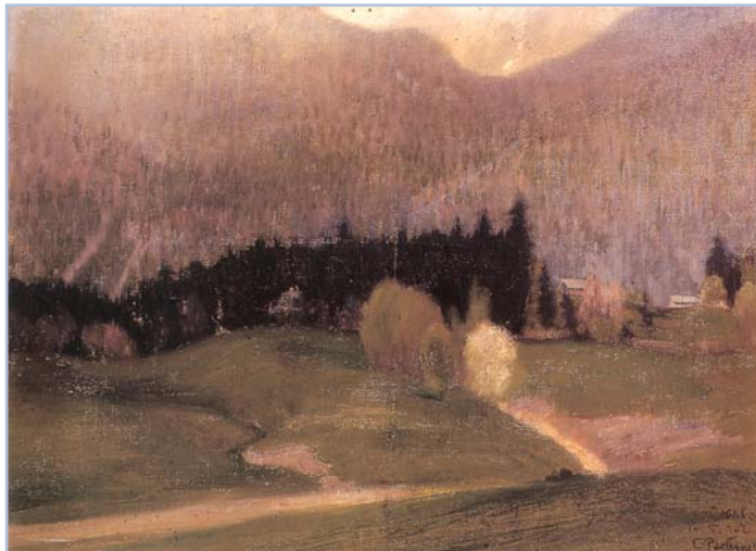
Κωνσταντίνος Παρθένης, Τοπίο με έλατα

Α. ντε Σαιντ-Εξυπερύ, Ο μικρός πρίγκιπας , μτφρ. Στρατής Τσίρκας, Ηριδανός