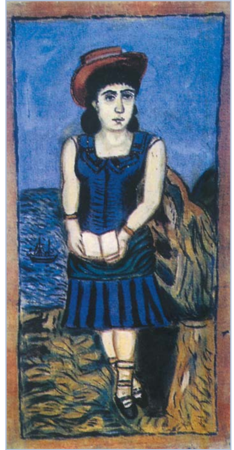
Θεόφιλος Χατζημηχαήλ, Το κορίτσι με το καπέλο

Η κυρία Νίτσα παντρεύτηκε το λοχαγό. Ήμουν παρών στους γάμους της. Καμιά ζήλια δεν τάραξε την ψυχή μου. Τα δέκα χρόνια που μας χωρίζουν δεν αποτελούν πια ανυπέρβλητο διανοητικό και κοινωνικό εμπόδιο. Ο κοσμοπολιτισμός μάς έχει φέρει σε ίση μοίρα. Είναι ακόμα ωραία, μολοντί έχει χάσει το θέλγητρο της μισοσκότεινης τάξης. Είναι μια γυναίκα, και όχι οπτασία. Ο άντρας της είναι πια συνταγματάρχης που έχει λάβει μέρος σε τρία κινήματα. Ζει ευτυχισμένη, και έχει μια κόρη που της μοιάζει πολύ. Δε μας χωρίζουν παρά δέκα χρόνια, μα αυτή τη φορά εγώ είμαι ο μεγαλύ-